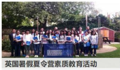
英国暑假夏令营素质教育活动