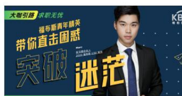
福布斯青年精英职业规划讲座