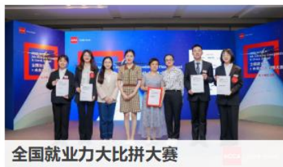
全国就业力大比拼大赛

组织学生参加专业赛事、境外名校实地研学、班级特色活动等多样化素质拓展活动，提升综合素质，开拓国际视野。