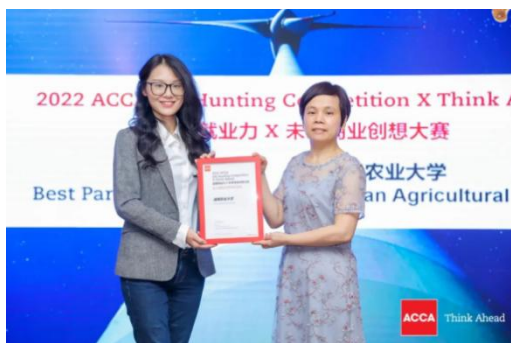
荣获 2022 ACCA JHC 长沙赛区“优秀组织院校”