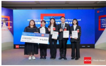
湖南农业大学代表队获得 2022 ACCA JHC 长沙赛区亚军