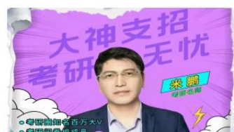
考研名师大V直播课