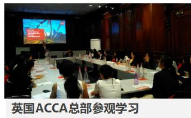
英国ACCA总部参观学习