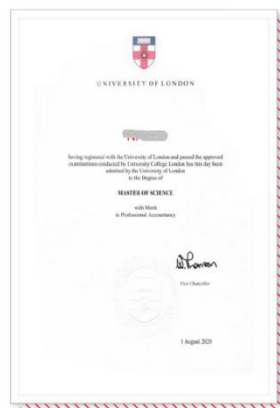
伦敦大学专业会计硕士学位 ——（全科通过可申请）——

(2) 可申请就读海外名校硕士学位，实现不出国门的学历背景提升（完成 ACCA 相应阶段全球统考及按官方要求提交申请资料）。