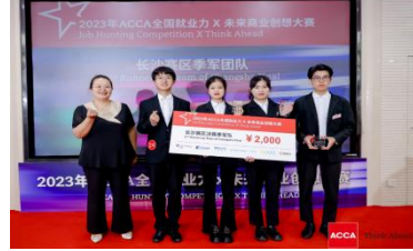
湖南农业大学代表队获得 2023 ACCA JHC 长沙赛区季军