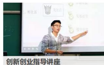
创新创业指导讲座