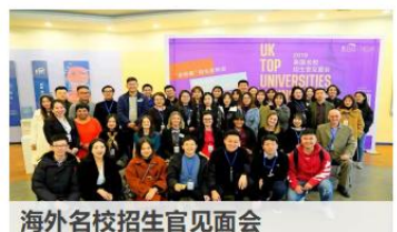
海外名校招生官见面会