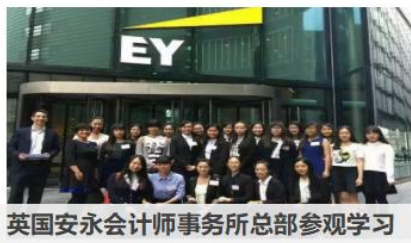
英国安永会计师事务所总部参观学习