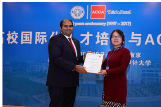
荣获 2019 年度全国 ACCA 优秀高校荣誉称号

同时，在学校的大力支持与楷柏财经教育的协同培养下，学生各方面表现突出，培养质量凸显。