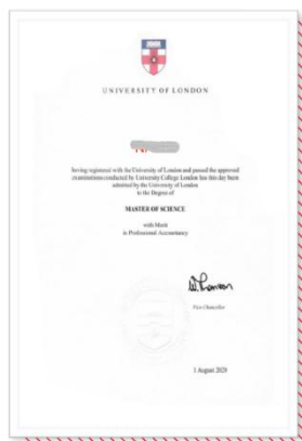
伦敦大学专业会计硕士学位 ——（全科通过可申请）——

全球范围内众多顶尖名校均认可 ACCA 课程的专业性与权威性，部分名校设置了与 ACCA 课程无缝衔接的硕士课程、并给予了相应学分减免。ACCA 学生成为准会员后，最快六个月即可获得世界顶尖名校伦敦大学专业会计硕士文凭，极大地减轻留学时间与金钱成本。